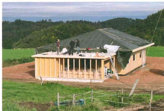
Der Autounterstand in St. Antoni (FR) ist das erste Bauwerk, das mit dem Holzbausystem Timber Structures 3.0 errichtet wurde.

Mitte September 2013 wurde als erstes Objekt ein Autounterstand in St. Antoni (FR) mit der neuen Technologie erstellt. Hier wurde das Dach mit asymmetrischen Brettsperrholzplatten ohne Pressdruck auf Abstand verklebt. Durch die Verklebung entstand eine allseitig gelagerte Platte mit den Abmessungen 8,70 x 6,30 m. Durch die Asymmetrie des Aufbaus entstand eine Plattenwirkung, die in Längs- und Querrichtung dieselbe Steifigkeit und Festigkeit erreicht. Die Plattendicke konnte dadurch auf 120 mm verringert werden.