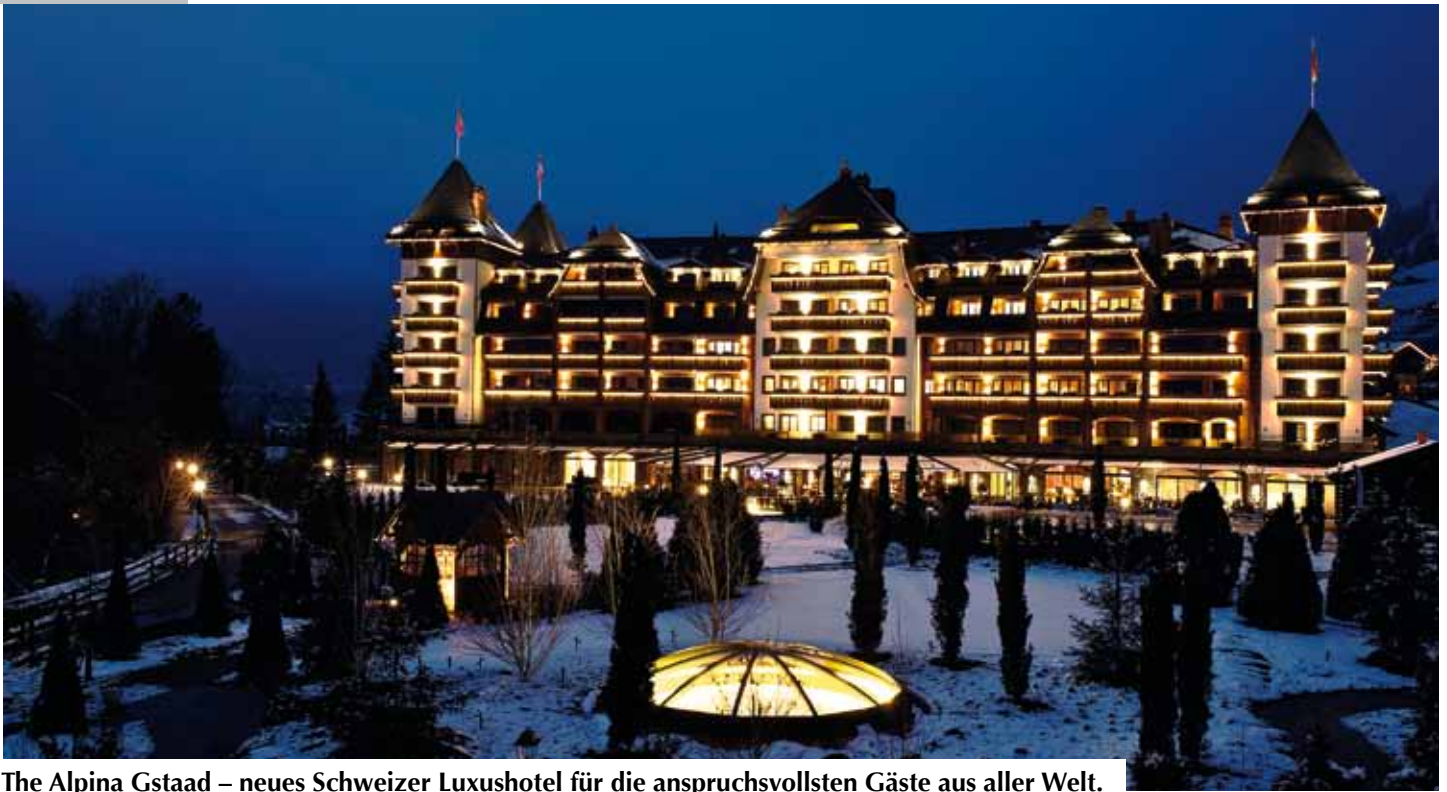
The Alpina Gstaad – neues Schweizer Luxushotel für die anspruchsvollsten Gäste aus aller Welt.