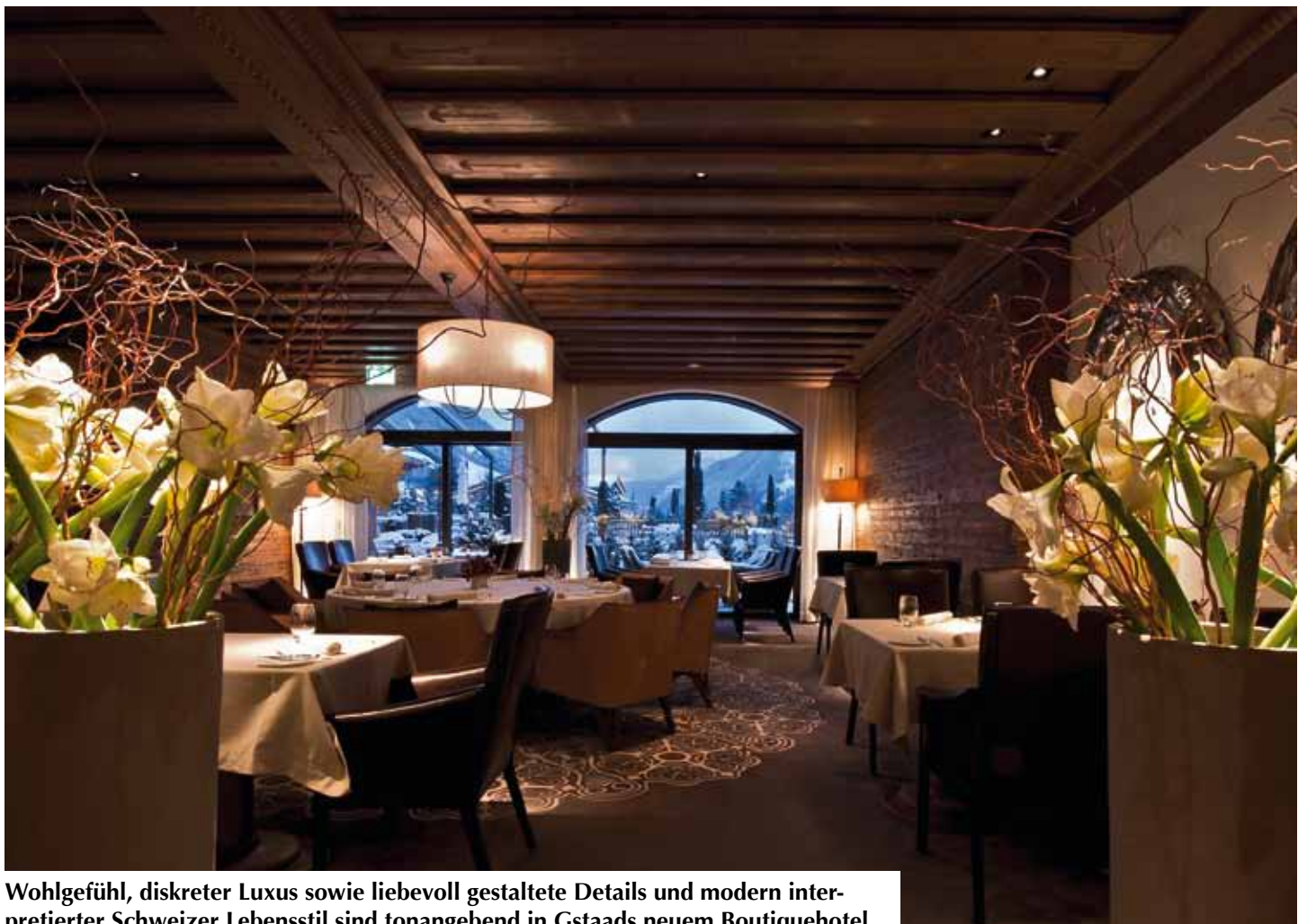
Wohlgefühl, diskreter Luxus sowie liebevoll gestaltete Details und modern interpretierter Schweizer Lebensstil sind tonangebend in Gstaads neuem Boutiquehotel.