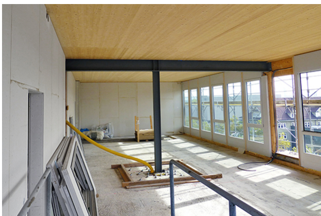
Structure primaire en acier