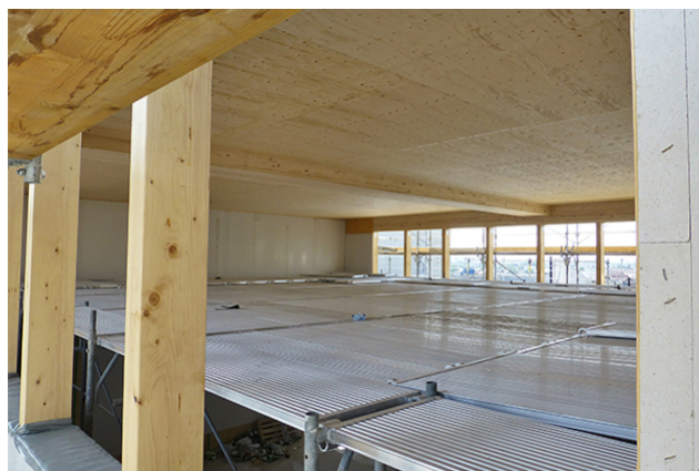
Atrium de plafond de 12 m d'envergure