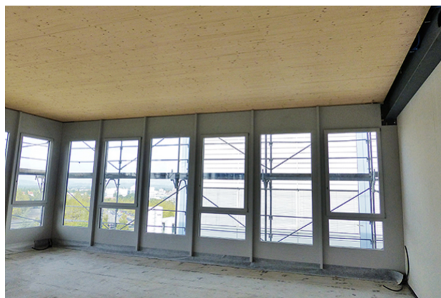
Plafond en bois d'une portée de 9 m