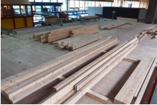
Plate-forme de travail Flück Holzbau AG, Wangen

Avec la TW-Agil 3000, Flück Holzbau AG a installé un centre d'usinage qui n'a pas son pareil en Suisse. Pour le traitement des éléments en bois découpés, l'entreprise de construction en bois a fait appel à Timbatec et TS3 pour la construction d'une plateforme de travail en bois., Wangen