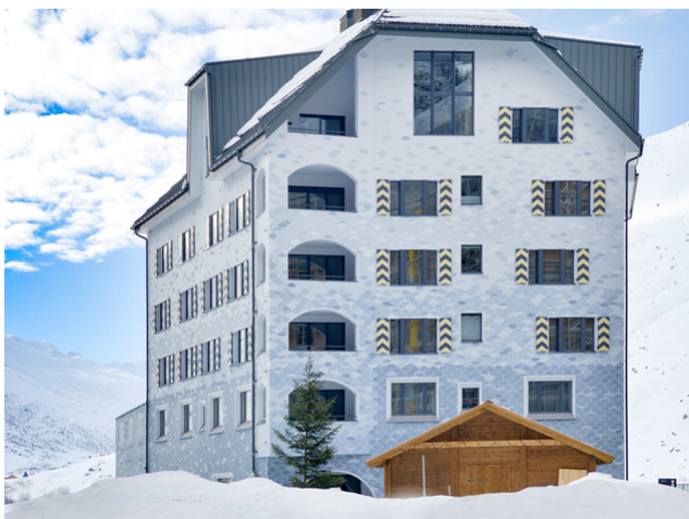
Toitures pour charges lourdes : Timbatec a conçu les structures de toit