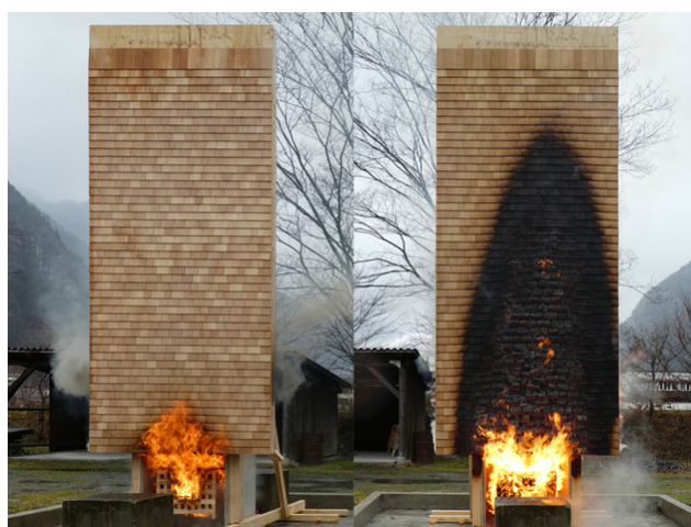
Un essai d'incendie de la façade en bardeaux