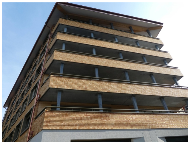
Appartementhaus Wolf : recouvert de bardeaux de bois de haut en bas