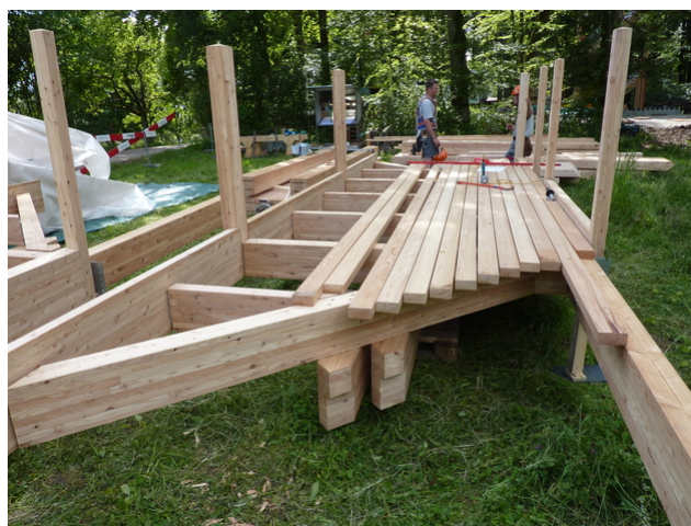
Assemblage de la tour