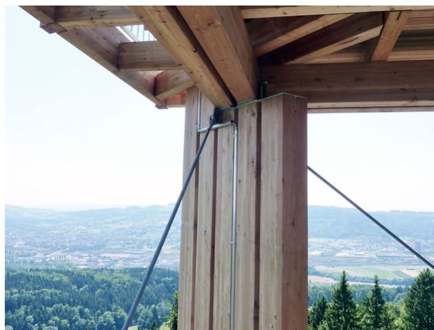
Appui Plate-forme 1

Les poteaux, limons et garde-corps intérieurs sont portés par des consoles en acier, ce qui a permis de réaliser une construction assez filigrane. Le renforcement contre les forces extérieures comme le vent est assuré par un système de tirants. La plate-forme d'observation est recouverte d'un toit en croupe composé d'éléments en caisson creux.