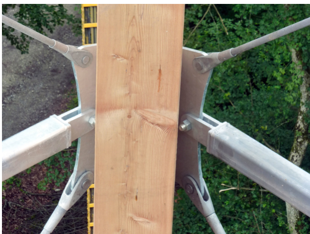
Raccord de barre de traction et de compression

Lors de la phase de concours, il a été convenu que la tour devait être construite de la manière la plus filigrane possible, à l'instar de la Tour Eiffel. Mais comment la forme de la tour Eiffel est-elle compatible avec la surface du plan ? Comment créer l'escalier et une plate-forme respectable qui offre suffisamment d'espace aux visiteurs pour une vue panoramique ? C'est ainsi qu'est née l'idée de retourner la Tour Eiffel et de la prendre en négatif abstrait dans un corps enveloppant cubique. L'escalier en spirale se tourne vers l'extérieur en forme d'escargot dans l'espace ainsi libéré, jusqu'à ce qu'il atteigne la plate-forme à 30,15 m de hauteur. La plateforme d'observation se trouve à environ 5 m au-dessus de la cime des arbres et permet une bonne vue panoramique.