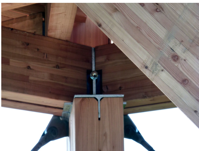
Appui Plate-forme 2