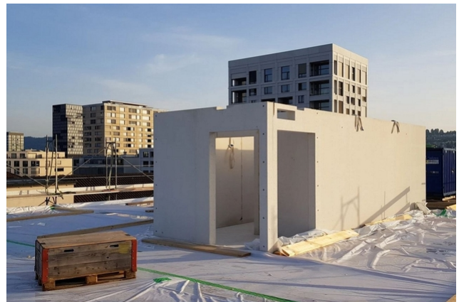
Treppenhaus in der Bauphase