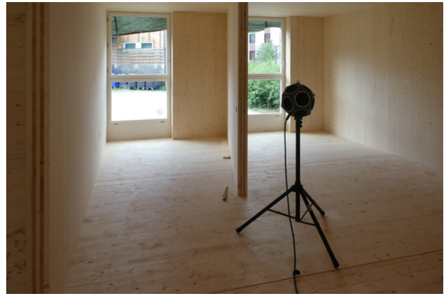
Schallmessung im Mockup