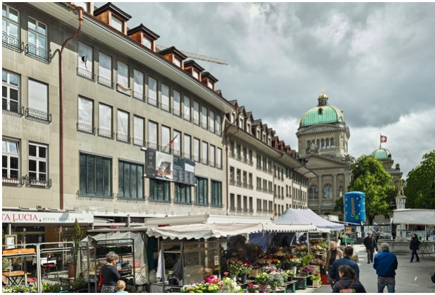
Die Front mit Sicht auf das Bundeshaus